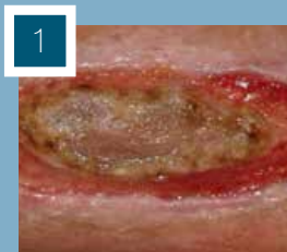
Wundstatus nach 1 Tag

Ergebnis: Mit Umstellung auf Cutimed® HydroControl (als Primärauflage) und 3-tägigem Verbandwechselintervall, konnte bereits nach 1 Monat eine deutliche Verbesserung der Wunde festgestellt werden. Nach 3 Monaten war eine deutliche Verkleinerung der Wunde zu erkennen.