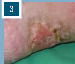
Wundstatus nach 4 ½ Monaten

Sie sind an weiteren Fallbeispielen interessiert? Dann schreiben Sie uns gerne eine E-Mail an cutimed@bsnmedical.com .