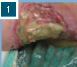
Wundstatus nach 1 Tag

Ergebnis: Aufgrund starker Wundschmerzen wurde zunächst eine autolytische, antimikrobielle Therapie mit Cutimed® Sorbact® Kompressen und Cutimed® Gel begonnen und eine systemische Antibiose eingeleitet. Nach einer Behandlungszeit von 4 ½ Monaten konnte festgestellt werden, dass die Sehne übergranuliert ist und die Wunde sich verkleinert hat.